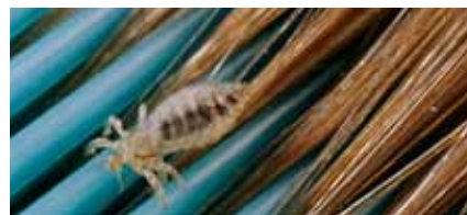
Hoofdluis op een kam.